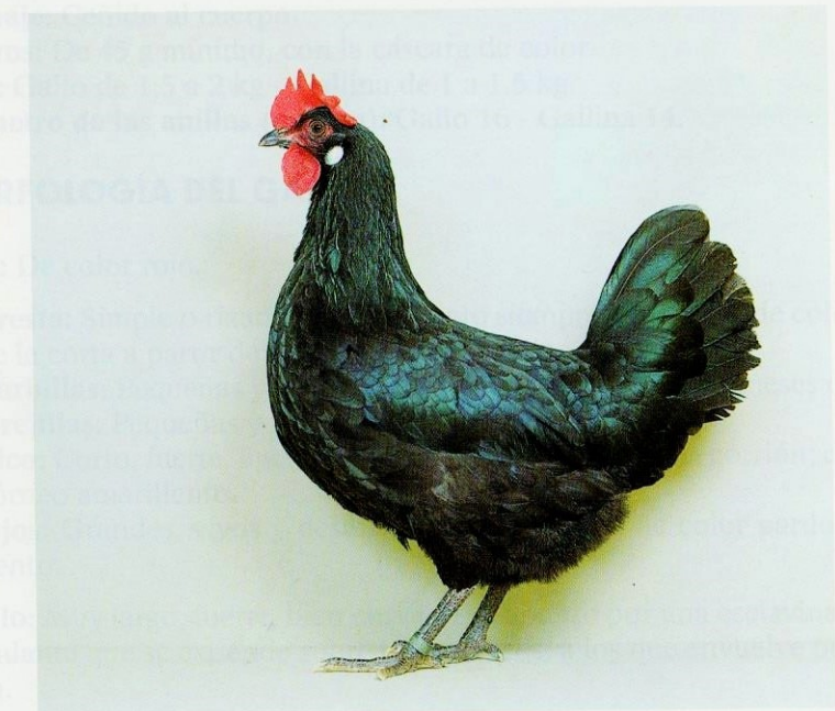
Gallina Castellana Negra